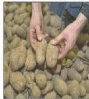
De grofte van de aardappelen varieert zelfs binnen de partijen.

Door de koude en droge start van het seizoen was de knolzet-